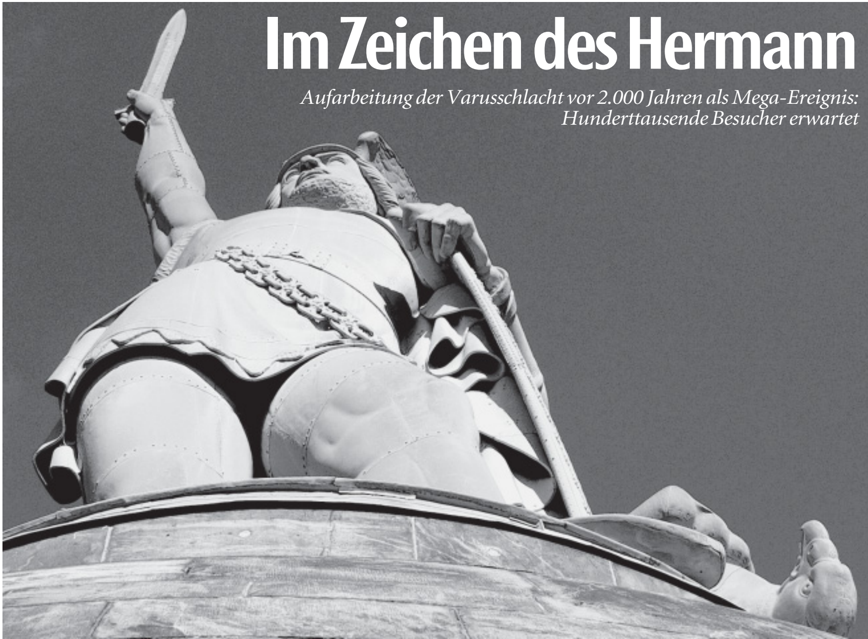
Sinnbild der Varusschlacht: Das Hermannsdenkmal in Detmold. Unter dem linken Fuß des Cheruskerfürsten liegt ein Adler, Symbol des Römischen Reiches.

Die Physikerin Merkel und der Chemiker Sauer lernten sich zu DDR-Zeiten in Berlin kennen, am Zentralinstitut für physikalische Chemie. Sie heirateten 1998. Für beide ist es die zweite Ehe. (dpa)