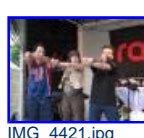
IMG_4421.jpg 52.93 KB