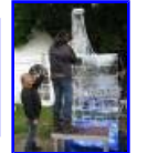
IMG_4438.jpg 61.64 KB