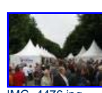
IMG_4476.jpg 55.81 KB