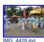
IMG_4428.jpg 86.09 KB