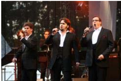
Die jungen Tenöre begeisterten rund 1000 Zuhörer bei der Eröffnung der Waldbühne am Hermann

Lippe/Detmold. Was hat es im Vorfeld und im Rahmen der Planungen doch viele Diskussionen darüber gegeben, ob denn eine Waldbühne da am Hermann angelegt werden solle, was solch ein Projekt denn bringe, ob das denn auch Wald-gerecht verträglich sei und, und, und... Seit dem Abend des Pfingstsamstags 2009 dürften alle Zweifler verstummt sein. Was die Kulturagentur des Landesverbandes Lippe, die Lippe Tourismus und Marketing AG, die Stadt Detmold und der Kreis Lippe da in einer Schlucht am Fuße des Hermann eingerichtet haben, ist grandios – für Lippe eine Riesen-Attraktion mehr! Dazu ein unvergessliches Konzert der „Jungen Tenöre“, die mit neapolitanischen Liebesliedern zum Träumen einladen und mit Hits der 50-er Jahre genauso begeisterten wie mit Tenor-Arien aus bekannten Opern, mit dem Ohrwurm „Eloise“ oder dem kräftigen „Granada“. Dieser Abend hatte Stil, war ein Traum für alle, die dabei sein durften.