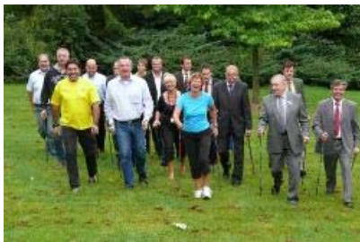
Die meisten der Probeläufer des heutigen Vormittags weden am 20. September allerdings nicht an den Start gehen.

Lippe. Die Arbeitsgemeinschaft Cherusker Walk (zuständig für die Planung, Organisation und Ausführung) sowie die Lippe Tourismus & Marketing AG (als Veranstalter) führen am 20. September 2009 zum fünften Mal diese große sportliche Tourismusveranstaltung im lippischen Teil des Teutoburger Waldes durch. In den vergangenen Jahren planten, organisierten und realisierten Touristiker, Gesundheitsexperten, Sportler, Vereine und Wirtschaftsfachleute über die Gemeindegrenzen hinaus für die Region Lippe ein solches Großereignis. Mit 1.250 Startern war der Cherusker Walk gleich zur Premiere der zweitgrößte Nordic-Walking-Event in Deutschland.