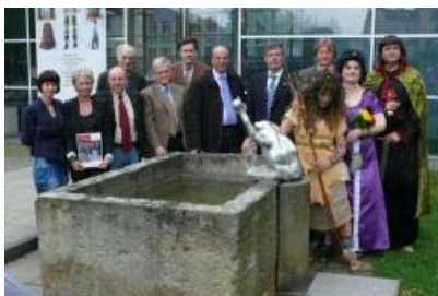
Organisatoren, Gastgeber und Akteure erwarten riesigen Besucherstrom am Hermann

Lippe/Detmold. Im Varusjahr 2009 waren die HermannTage ein Highlight; und auch in diesem Jahr sind sie eine eindrucksvolle Auftaktveranstaltung des Kulturprogramms Hermann 2010 und werden gemeinsam mit den Lippischen Heimattagen ausgerichtet. Auch die Waldbühne am Hermannsdenkmal wird am 15. Mai 2010 die Saison mit einem absoluten Top-Act eröffnen. Und das an einem Veranstaltungsort, der es im Varusjahr erstmals unter die TOP 15 der deutschen Lieblingssehenswürdigkeiten geschafft hat – dem Hermannsdenkmal.