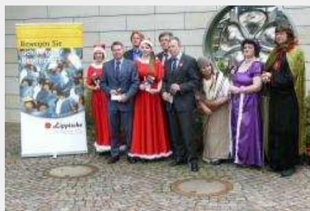
Sponsoren, Veranstalter und Akteure freuen sich auf das erste große Wochenende rund um den Hermann