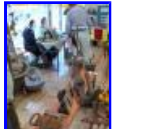
P1370360.jpg 81.24 KB