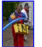
P1370367.jpg 69.71 KB