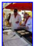
P1370389.jpg 70.78 KB