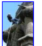
P1370383.jpg 68.2 KB