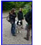
P1370366.jpg 82.49 KB