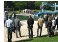
Brackwede Forum Naturbaden