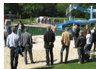
Brackwede Forum Naturbaden