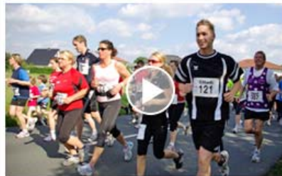
Rund 500 Teilnehmer starten in der Senne 1. Sternchenlauf ein voller Erfolg